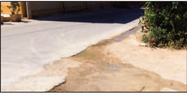
LA FUORIUSCITA DI ACQUA LUNGO LE STRADE