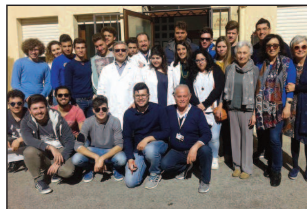
GLI STUDENTI DEL COMMERCIALE ALL'AVIS