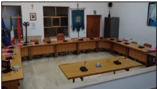
AULA CONSILIARE DI PETROSINO