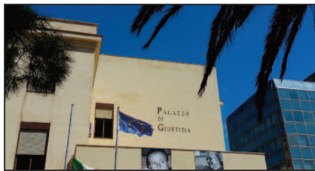
TRIBUNALE DI MARSALA