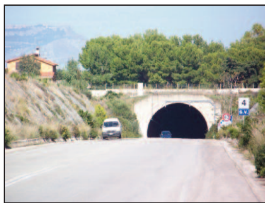
UN TRATTO DELLO SCORRIMENTO VELOCE

Slitta a data da determinare la chiusura di un tratto dello Scorrimento Veloce Marsala-Aeroporto "Vincenzo Florio", quello compreso tra la stazione di rifornimento carburanti e il successivo svincolo di contrada Bosco. Lo stabilisce un provvedimento del sindaco Alberto Di Girolamo, con il quale si prende atto di quanto comunicato dal dirigente del settore Servizi pubblici locali. In pratica, a fronte di alcuni lavori già appaltati, ve ne sono altri per i quali è in corso la procedura di aggiudicazione e, pertanto, risulta incerta la data di inizio degli interventi. Si vuole evitare, in pratica, che si chiuda la galleria per eseguire lavori parziali, rischiando di mantenerla ancora interdotta al traffico in assenza degli altri interventi programmati. Nella stessa ordinanza sindacale si impone l'obbligo di rispettare la segnaletica (divieti, limitazioni, ecc.) già prevista con precedenti provvedimenti, e ciò al fine di garantire la sicurezza della circolazione stradale ed avvisare i conducenti sui pericoli connessi.