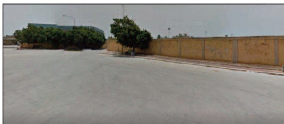
IL LUOGO DELL'INCIDENTE