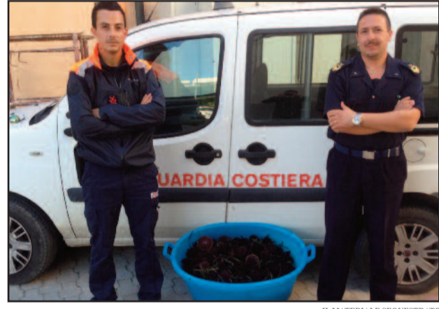
IL MATERIALE SEQUESTRATO

Nella giornata di ieri, la Guardia Costiera di Marsala ha effettuato il sequestro di circa 400 ricci di mare. L'operazione ha avuto corso in due diversi punti, sul Lungomare Mediterraneo, all'altezza delle Cantine Florio e a Giardinello, nel comune di Petrosino. Si tratta di 400 esemplari di Echinoidea, comunemente chiamato riccio di mare. La normativa di settore prevede che un pescatore sportivo possa pescare un quantitativo massimo di 50 esemplari. Ai soggetti, un Palermitano ed un Marsalese, è stata elevata una sanzione di 4mila euro ciascuno, mentre i ricci sono stati sottoposti a sequestro e subito dopo rigettati in mare. “Le attività di controllo, sia in mare che lungo la costa - riferisce la Guardia Costiera di Marsala -, continueranno con frequenza e riguarderanno l'intera filiera della pesca, a tutela dei consumatori, ma anche dei pescatori professionali, nel rispetto del duro ed onesto lavoro che compiono”. [ ro. ma. ]