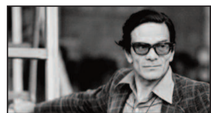
PIER PAOLO PASOLINI