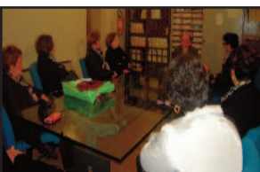
UN MOMENTO DELL'INIZIATIVA