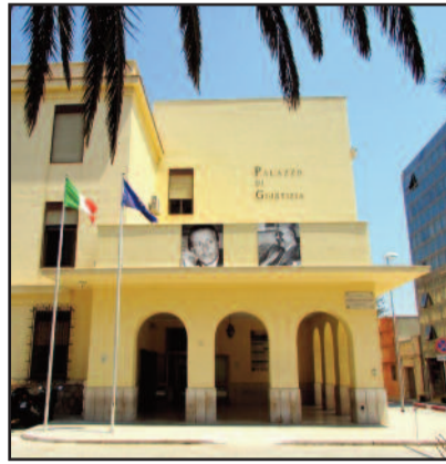
TRIBUNALE DI MARSALA