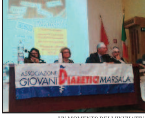
UN MOMENTO DELL'INIZIATIVA

“Pancreas artificiale, micro infusori di nuova generazione, vecchie generazioni, iniezioni di insulina, farmaci ad assunzione orale contro il diabete, ma soprattutto corretti comportamenti alimentari”.