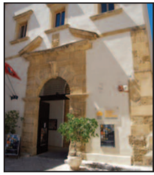
L'INGRESSO DEL CONVENTO DEL CARMINE