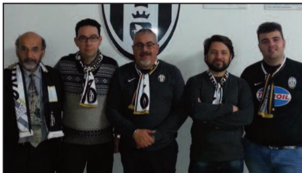
ALCUNI COMPONENTI DEL CLUB DI MARSALA

non fare morire la memoria. Nel nostro caso questa raccolta di firme, alla quale chiamiamo a firmare tutti gli appassionati di calcio e non solo, senza per una volta pensare al colore della fede calcistica, è per noi un importante e doveroso riconoscimento verso coloro i quali, nel nome dello sport, hanno dato tutto, anche la propria vita. Mi riferisco a Gaetano Scirea, un grande esempio di sportività e lealtà. Voglio ricordare che Scirea per il 3 settembre del 1989 a causa di un incidente stradale mentre si recava in Polonia come osservatore della Juventus. La strada (senza nome) che vorremmo fosse intitolata "Via Gaetano Scirea" è l'arteria che collega la via degli Atleti con la