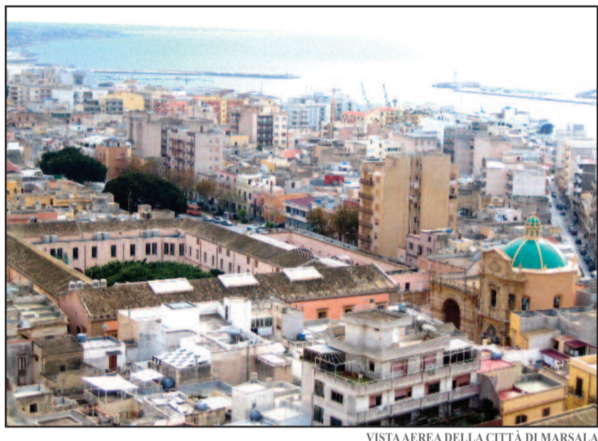
VISTA AEREA DELLA CITTÀ DI MARSALA