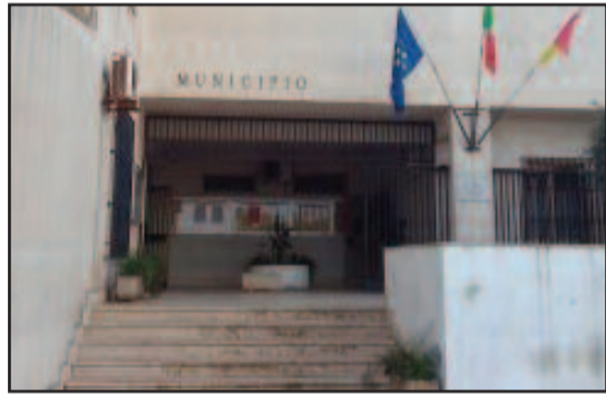
COMUNE DI PETROSINO