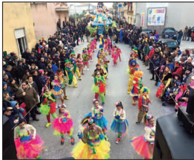
IL TEAM GOLDEN MAJORETTE