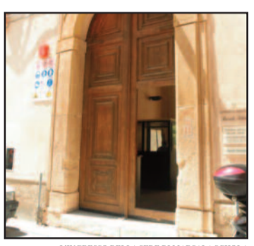
L'INGRESSO DELLA SEDE DI MARSALA SCHOLA

diversi elementi positivi che generano delle economie di gestione, con conseguenti vantaggi per l'Ente Comune. La Giunta Di Girolamo ha valutato che si otterranno risparmi, principalmente, con riguardo alle spese di consulenza (contabile, fiscale, informatica, legale e notarile) quantificabili in oltre 60 mila euro all'anno. Inoltre, si avranno risvolti economici positivi anche da una migliore razionalizzazione delle risorse umane, infatti i dipendenti di Marsala Schola saranno riassorbiti dal Comune, dove continueranno a prestare servizio e dalla eliminazione della sovrapposizione di Uffici con medesime competenze. La delibera della Giunta Municipale sarà ora trasmessa al Consiglio comunale che dovrà pronunciarsi sullo scioglimento dell'Istituzione. Per il vero già negli anni precedenti, con l'allora sindaco