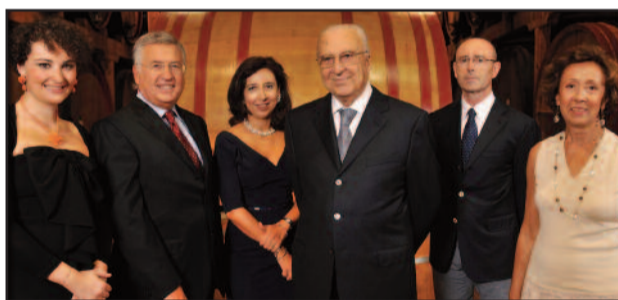
I RESPONSABILI DELLE "CANTINE PELLEGRINO"

L'edizione 2015 di "ViniBuoni d'Italia", l'unica Guida ai vini da vitigni autoctoni del nostro Belpaese edita dalla Touring Editore, ha premiato il "Marsala Doc Fine Rubino" prodotto dalle Cantine Pellegrino, con una Golden Star, concorrendo anche alla nomination per la Corona, il massimo riconoscimento che l'importante Guida attribuisce ai vini. A seguito delle degustazioni e delle selezioni operate, la commissione della Guida "ViniBuoni" d'Italia infatti, ha voluto premiare l'azienda marsalese con il prestigioso elogio. Le Golden Star, ovvero i vini che concorrono alla Corona, sono quei prodotti che, raggiunti le quattro stelle, hanno ottenuto la Stella d'Oro, perché esprimono eleganza, finezza, equilibrio, qualità, precisa espressione del varietale e del territorio e hanno destato un'esaltante emozione. Per l'occasione la "ViniBuoni" organizzerà uno straordinario evento per l'assegnazione delle Corone, che si terrà a Buttrio (UD) dal 24 al 26 luglio, in collaborazione con l'ERSA - Agenzia Regionale per lo Sviluppo Rurale, con il Comune di Buttrio e la Pro Loco Buri. Le Cantine Pellegrino saranno presenti al rinomato evento che le porterà, inoltre, a partecipare ad altre importanti kermesse, per valorizzare e promuovere i propri vini scelti dagli esperti. A comporre la Giuria saranno il curatore della Guida, Mario Busso, Alessandro Scorsone che ha firmato le selezioni