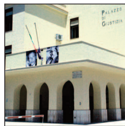
TRIBUNALE DI MARSALA

GIUDIZIARIA /2 I militari erano accusati di non aver denunciato le violenze per cui sono imputati