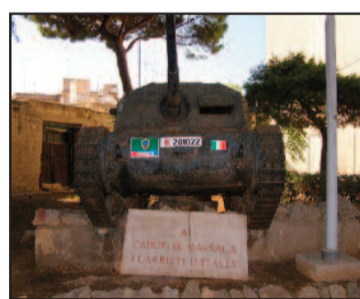
IL CARRO ARMATO DI PIAZZA MARCONI (PORTICELLA)

ronautica ed ai paesi dell'ex blocco orientale. In tutte le sale espositive i visitatori potranno visitare cimeli storici, uniformi, armi, un aereo da caccia, ed una tradotta militare del '15/'18 composto da una locomotiva ed un carrello ferroviario d'epoca. Il Museo è aperto anche alle scolaresche ed agli alunni più meritevoli sarà offerto un simpatico ricordo. Questo l'orario delle visite: dalle ore 9 alle 11.30. L'ingresso è gratuito ma saranno gradite eventuali offerte.