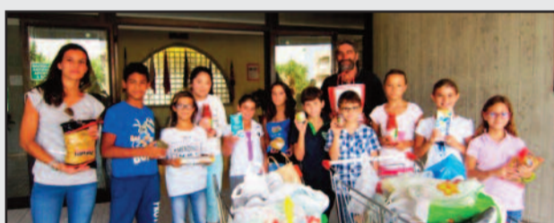
UN MOMENTO DELL'INIZIATIVA