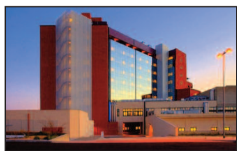
OSPEDALE "P. BORSELLINO"

punto e amarezza di fronte tale notizia - afferma -. Se i reparti verranno accorpato, fatto ormai quasi sicuro, si andranno a perdere le professionalità già acquisite. Tutto ciò avverrà in totale dispregio del crono-programma e delle intese sottoscritte a regolare il funzionamento dell'ospedale di Mazara in questo periodo in cui la città di non può contare sul proprio nosocomio a causa dei lavori all'ospedale".