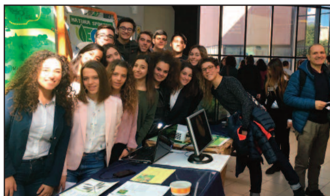
UN MOMENTO DELL'INIZIATIVA

gazzi hanno presentato un lavoro sull'Ambiente fluviale. Dall'esperienza sul campo hanno ricavato alcuni dati geografici, geologici e morfologici, hanno studiato chiavi dicotomiche per la classificazione degli esseri viventi del territorio e successivamente analizzato il calcolo dell'indice biotico esteso delle acque del fiume. È stato realizzato un erbario con le essenze più rappresentative della flora della fiumara, estrapolando foto, schede, poster e realizzando un acquario; tutto materiale che, presentato nell'exhibit, descriveva i fattori biotici e abiotici relativi all'area fluviale naturale della fiumara del Sossio, nel territorio marsalese. Gli alunni non impegnati in alternanza scuola-lavoro hanno visitato la mostra presso l'edificio 19 di Viale delle Scienze, hanno partecipato a convegni e laboratori, visitato alcuni musei. La sperimentazione la-