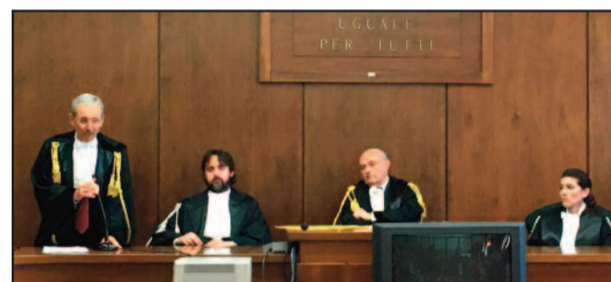
UN MOMENTO DELL'INSEDIAMENTO

Arriva in un momento complicato per Marsala il nuovo Procuratore Capo Vincenzo Pantaleo. Il nome del maresciallo Silvio Mirarchi è stato ripetuto più volte, ieri mattina, nel corso della cerimonia di insediamento del magistrato scelto dal Csm per guidare la Procura che dall'86 al '91 fu di Paolo Borsellino. Così come, in diversi interventi, si è insistito sul ruolo che Cosa Nostra continua a ricoprire in questo territorio. Lo ha fatto anche Pantaleo, che ha ricordato come la mafia sia ancora "incisiva, dotata di ingenti risorse economiche e capace di proselitismo", attiva nel traffico di droga, nel racket, ma anche negli appalti. Il neo Procuratore ha inoltre evidenziato come in diverse aree non si registri ancora un pieno ripudio del fenomeno, ma piuttosto "consenso o accettazione", ricordando poi la presenza di latitanti storici, come Matteo Messina Denaro, a cui lo Stato continua a dare la caccia da 24 anni. Nella relazione presentata nell'aula "Paolo Borsellino", Pantaleo ha comunque indicato altri ambiti su cui intende con-