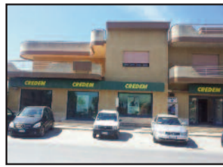
IL LUOGO DELLA RAPINA

P resa di mira da due malviventi la filiale del Credem di contrada Strasatti, a Marsala, di fronte la centralissima piazza Fiera. In pieno giorno, davanti agli occhi di tutti, hanno fatto irruzione in banca un uomo con il volto scoperto, con in testa una parrucca, e dietro di lui il suo complice. I due erano armati di pistola e taglierino e sono riusciti a portarsi via un bottino di circa mille euro. Fuori dall'istituto di credito inoltre, ad attenderli vi era un terzo complice che si trovava a bordo di uno scooter che aveva lasciato appositamente acceso, pronto a ripartire. Messo a segno il colpo, i tre malviventi si sono dileguati repentinamente per le vie limitrofe di Strasatti, facendo perdere in breve tempo le loro tracce. Nel frattempo i Carabinieri della Compagnia di Marsala hanno già avviato le indagini mettendosi sulle tracce dei tre che hanno commesso la rapina. [ ro. ma. ]