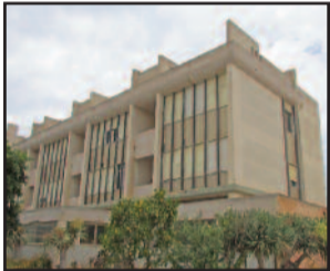
IL CONVITTO DEL "DAMIANI"