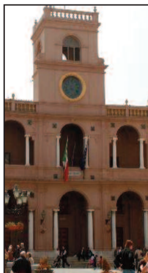
PALAZZO VII APRILE