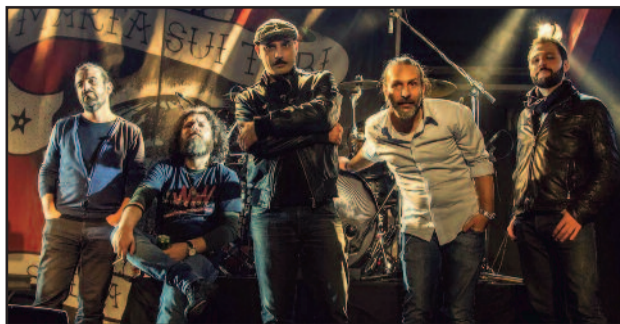
I MARTA SUI TUBI