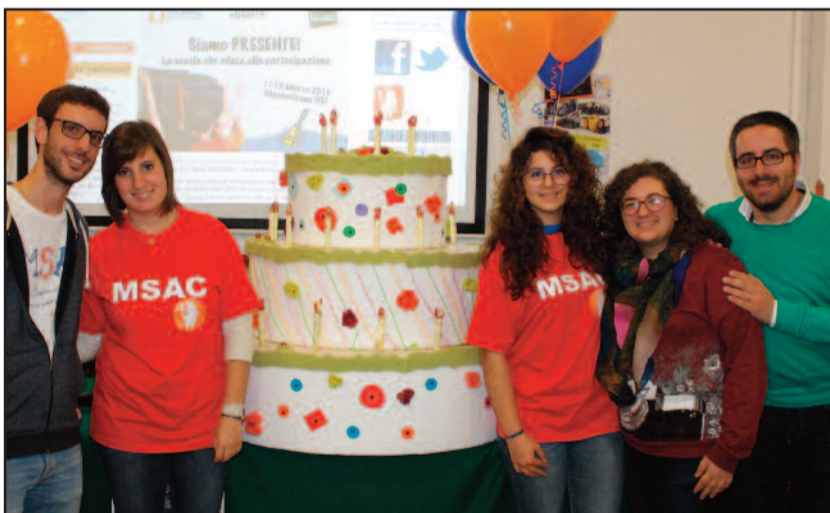
UN MOMENTO DELL'INIZIATIVA