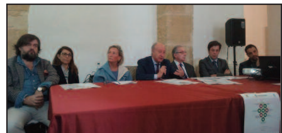
UN MOMENTO DELLA CONFERENZA STAMPA