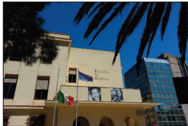
TRIBUNALE DI MARSALA

La Procura della Repubblica di Marsala ha avanzato una richiesta di rinvio a giudizio per il titolare di un oleificio che, secondo l'accusa, avrebbe incassato somme tramite carte di credito clonate. La prima udienza