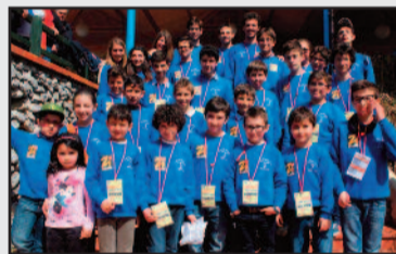
LA LILYBETANA SCACCHI