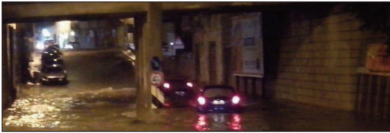
IL SOTTO PASSAGGIO DI VIA UGDULENA

O rmai sembra quasi un bollettino di guerra. Ad ogni pioggia strade e piazze marsalesi si trasformano in fiumi creando non pochi disagi ai cittadini. Vista la diffusione del fenomeno si sono addirittura diffusi sui social network fotomontaggi delle vie lilybetane allagate e "abitate" da squali e coccodrilli. La verità è che nelle scorse 48 ore i vigili del fuoco sono dovuti intervenire in via Mazara Vecchia dove è saltato – per l'ennesima