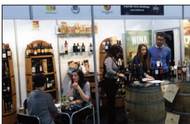
LO STAND MARSALESE