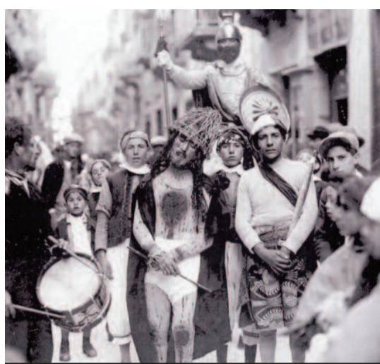
Un'immagine d'epoca della processione del giovedì Santo

maio, dei chiodi, dei dadi, la sacra sindone, dei vasi unguentari, dei martelli, Disma e Cisma dipinti e alzati in croce, e la figura, anch'essa dipinta, del Cristo Crocifisso; quindi segue Giuseppe d'Arimatea, Nicodemo, Giovanni, molti fanciulli e ragazze, vestiti alla giudea che piangono accanto alla salma di Gesù deposto e portato da loro. La statua di Maria Addolorata conclude la processione. [giovanni alagna]