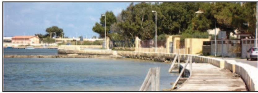
LUNGOMARE DELLO STAGNONE

Scriviamo qui di seguito una segnalazione che ci è pervenuta da diversi cittadini. Il fatto accade, quest'estate principalmente, lungo il litorale della Riserva dello Stagnone e in particolare nella strada che dall'Imbarcadero di Mozia giunge fino a dopo il lido della Lupa. La zona, ad oggi ravvivata di locali, siti balneari e lounge bar è molto frequentata e questo è sicuramente un buon segnale. Però è anche vero che, un po' per i bagnanti che si recano nei moli, un po' per la movida, la strada che costeggia il litorale è difficilmente percorribile a causa del "parcheggio selvaggio". Le auto vengono posteggiate lungo la strada che di per sé è già stretta, provocando ingorghi, intan-