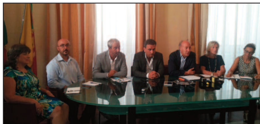
UN MOMENTO DELLA CONFERENZA STAMPA

IL SINDACO HA ILLUSTRATO LE INIZIATIVE PRESE PER IL RILANCIO DELLA CITTÀ