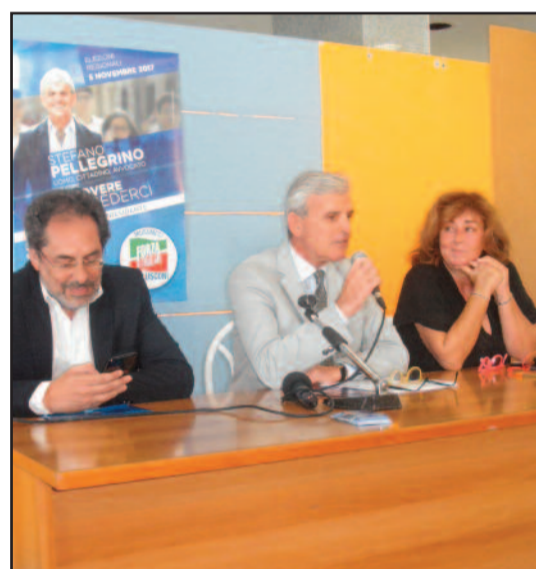
UN MOMENTO DELLA PRESENTAZIONE