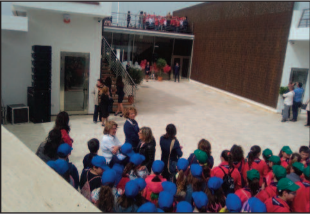
UN MOMENTO DELLA CERIMONIA