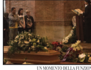
UN MOMENTO DELLA FUNZIONE