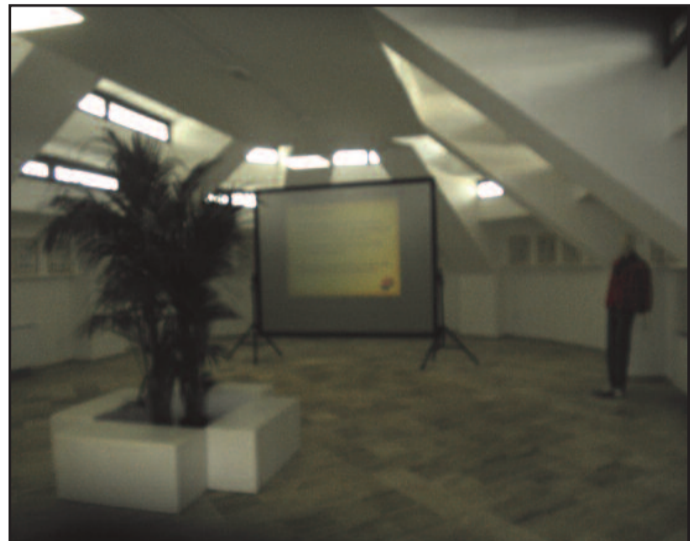
LASALA DEDICATA AI GARIBALDINI

momento si trova in via XI Maggio. Nella sede tradizionale, rimarranno invece gli uffici del Settore Turismo del Comune di Marsala. E' intendimento dell'Amministrazione, ma ancora non sono state decise le modalità, di dotare la struttura di un centro di ristoro. In tanti stanno pensando ad un bar che possa utilizzare oltre che le stanze interne, anche la veranda superiore. Da informazioni che abbiamo attinto, la struttura è dotata di tutti i mezzi tecnici che occorrono ad un centro di ristoro. Nelle prossime settimane conosceremo l'intendimento dell'Amministrazione lilybetana. [ g. d. b. - c. m. ]