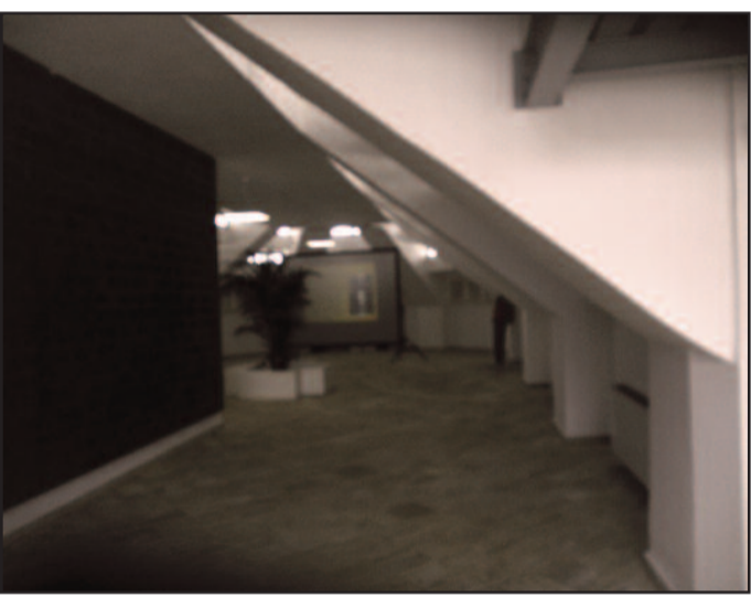
L'INTERNO DEL MONUMENTO AI MILLE

Ora che il momento di festa è trascorso, in tanti ci chiedono (ci chiediamo), come verrà utilizzato il Monumento ai Mille. All'interno della struttura, vi sono ampi locali, per la verità ancora parzialmente arredati, ma da quanto abbiamo appreso, contestualmente ai lavori, la Pubblica Amministrazione si è posta anche il quesito di vedere come l'opera potrà essere fruita dai marsalesi e dai turisti. Sembra certo che parte della struttura - probabilmente quella dove sono state collocate le foto dei garibaldini sbarcati a Marsala - verrà trasferita già dai prossimi giorni la Pro Loco che al