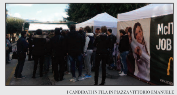
I CANDIDATI IN FILA IN PIAZZA VITTORIO EMANUELE

[ La scialuppa McDonald's ] - Ed è proprio quest'ultimo il dato più interessante. In un momento in cui i giovani emigrano o comunque faticano a trovare lavoro, un posto al McDonald's fa gola a tanti, nonostante sul web molti reduci mettano in guardia sui ritmi di lavoro massacranti e sulla rigidità delle regole imposte ai dipendenti. Più che a un'opportunità reale, però, un lavoro al McDonald's somiglia a una scialuppa di salvataggio di fronte a un mare in tempesta, in cui la disoccupazione giovanile è al 43.2% e torna a crescere l'emigrazione verso il Nord Europa. In uno scenario del genere diventa difficile coltivare grandi ambizioni. Si accumulano esperienze, sperando che arrivino condizioni migliori. Anche perché, chi magari prova a mettersi in gioco aprendo una partita iva o una start up fatica molto a rendere economicamente vantaggiosi i propri investimenti. Non è però con le scialuppe di salvataggio che il paese uscirà dalla crisi. Peccato che i nostri governanti siano troppo impegnati a parlare con gente come Carminati e Buzzi per accorgersene.