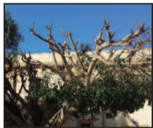
PIAZZA UGO FOSCOLO (CIMITERO)