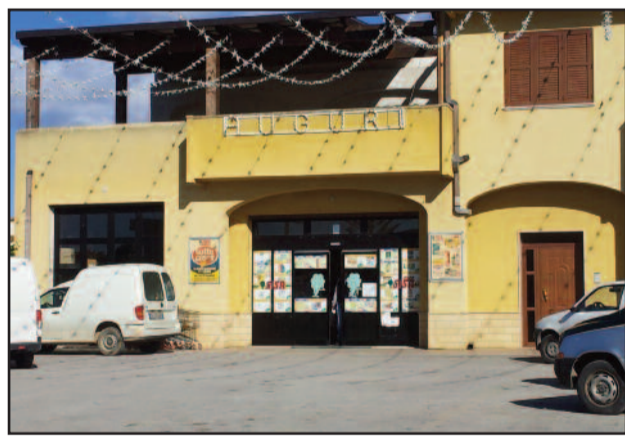
LA SISA DI STRASATTI

Anzi, per la verità, ha anche perso del denaro che poi è stato trovato dai carabinieri intervenuti sul posto poco dopo. I soldi erano sul piazzale antistante il supermercato. Nella stessa contrada, poche ore prima, una signora anziana era stata oggetto delle attenzioni di altri malviventi. Infatti la pensionata è stata scippata della sua collana d'oro che aveva al collo. E' accaduto nei pressi della via Nazionale, in una stradina limitrofa, non lontano da piazza Fiera. Nei giorni scorsi si è verificata un'altra rapina nella periferia sud del Marsala. In due, armati di pistola, si sono introdotti nel padiglione della ditta di spedizioni GLS. Hanno anche preso a botte uno