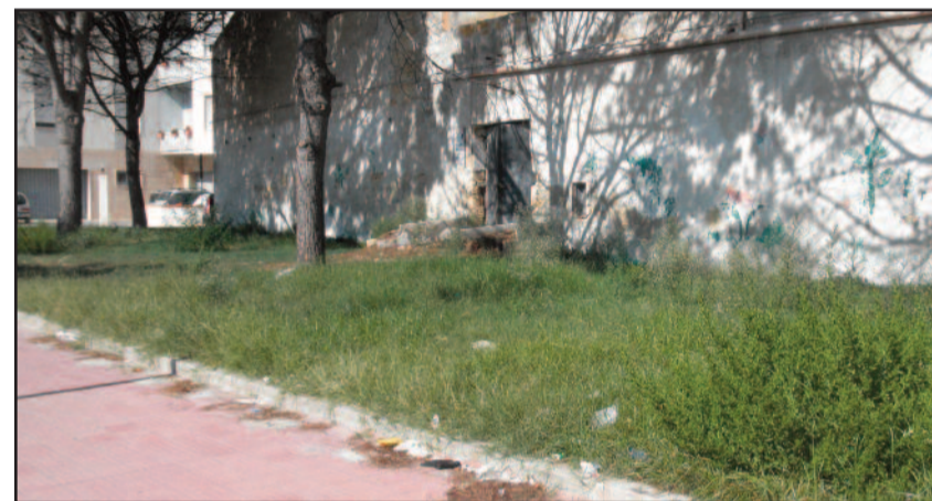
L'AREA MESSA IN VENDITA DAL COMUNE