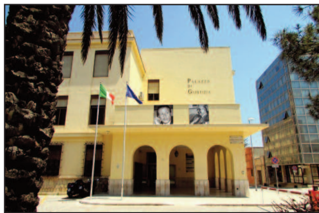
TRIBUNALE DI MARSALA