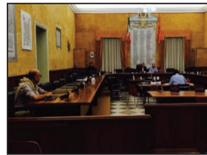
IL CONSIGLIO COMUNALE - IER INTORNO ALLE ORE 23.00